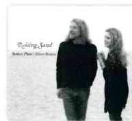
Raising Sand Robert Plant / Alison Krauss 2007