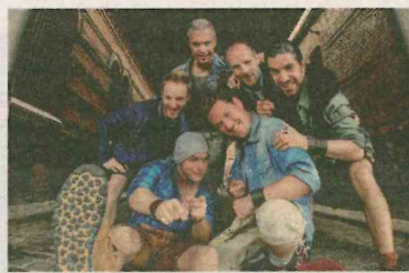
Die sympathischen Jungs von VoXXclub sind am 12. Dezember live in der Mausefalle.

■ STANS. Am 12. Dezember sind die Jungs von VoXXclub in der Mausefalle Schwaz zu Gast. Gewinnen Sie mit der Mausefalle Schwaz 5x2 Eintrittskarten für dieses Event. Ein Klick beim Gewinnspiel auf www.meinbezirk.at genügt. Teilnahme-schluss ist der 9. Dezember. Die Gewinner werden telefonisch benachrichtigt.