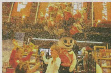
Der Schneemann, Markenzeichen des Zillertals, wird in München auch dabei sein.

■ Um auch im Jahr 2015 die Wintersportkompetenz des Zillertals zu zeigen, präsentiert sich das Zillertal gleich am 1.1.2015 beim FIS Ski Weltcup Parallelschlalom der Damen und Herren im Olympiapark München. Gewinnen Sie mit Zillertal Tourismus 2x2 Karten für dieses Top-Event. Ein Klick auf www.meinbezirk.at genügt. Teilnahme-schluss ist der 10.12.